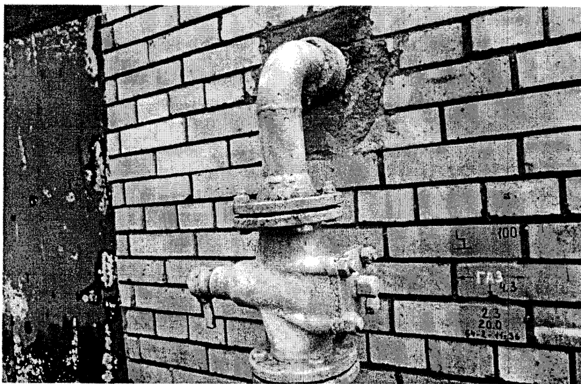
Московская область, г. Ступино, ул. Чайковского, д. 48/5

- неудовлетворительное состояние газопровода, а именно нарушение окрасочного слоя, следы коррозии;